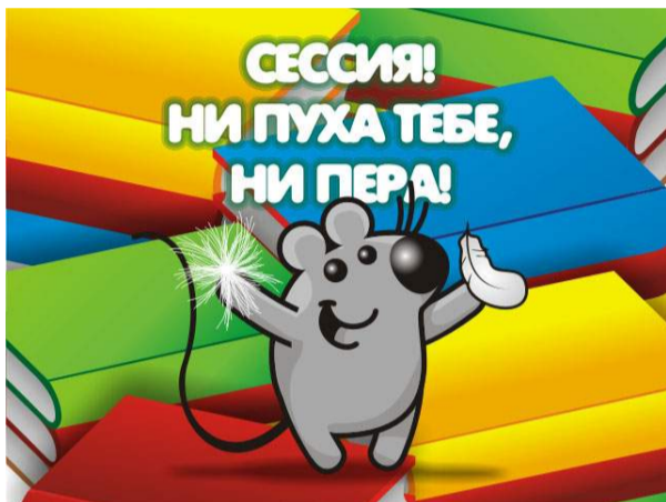
ГРАФИК УЧЕБНОГО ПРОЦЕССА НА I ПОЛУГОДИЕ 2014-2015 УЧ.Г.

– Необходимую дополнительную информацию для успешной сдачи экзаменационной сессии Вы можете найти в книгах электронно-библиотечных систем «Лань», «Книгафонд» и электронном читальном зале НТБ БГТУ